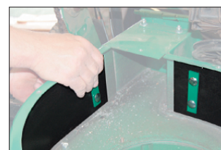
Volitelná vložka (obj.č.: 891134) chrání tělo stroje v písčítých podmínkách