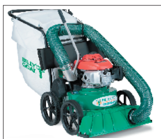
Samochodný model KV