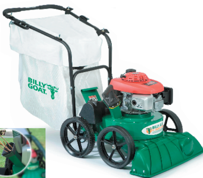
Samochodný model TKV s integrovaným štěpkovačem